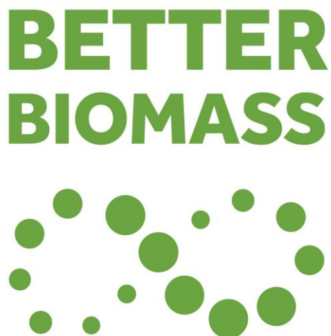
Figuur F.3 — 'Better Biomass'-logo voor niet-certificaathouders

Het 'Better Biomass'-logo dat door een organisatie anders dan een certificaathouder onder voorwaarden mag worden gebruikt is weergegeven in figuur F.3.